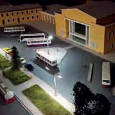
Neue Hauptstraße ▲