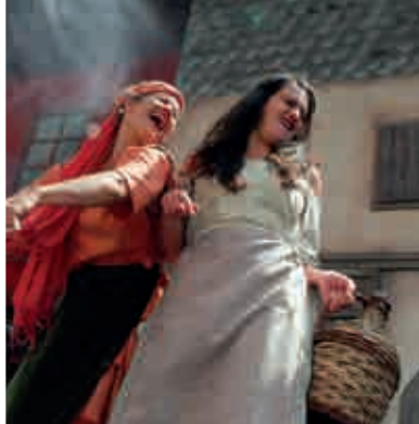
Mittelalterlicher Marktwirbel ▲