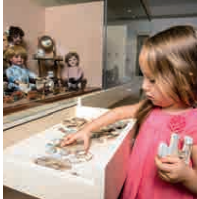
Spielzeugfestival Siebenmeilenland ▲