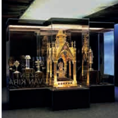
Diözesanmuseum Székesfehérvár ▲ Hauptaltar der Zisterzienserkirche ►