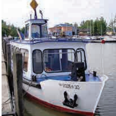
Velencer See ▲