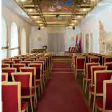
Kulturhaus Sankt Stephan ▲