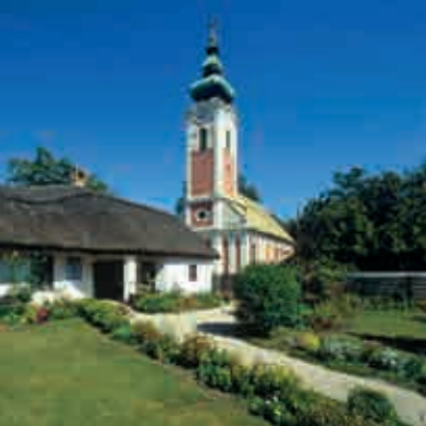
Freilichtmuseum in Palotaváros ▲