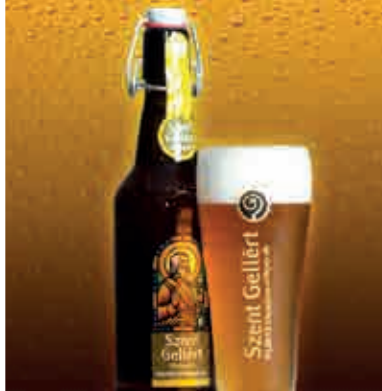
Jancsár Garden ▲