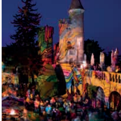
Festival Zeitgenössischer Kunst ▲