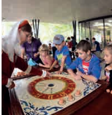
Spielzeugmuseum Siebenmeilenland ▲