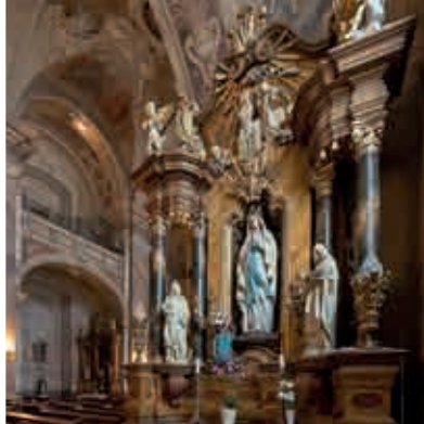
Kirche Sankt Emerich ▲