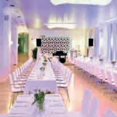
Veranstaltungszentrum Hiemer ▲