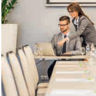
Hotel Novotel ▲