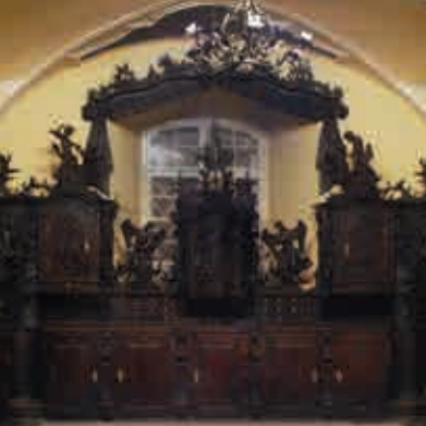
Sakristei der Zisterzienserkirche ▲