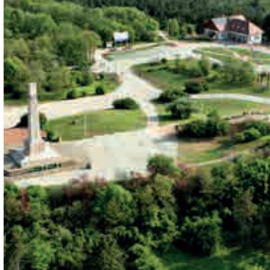
Militärischer Gedenkpark Pákozd ▲