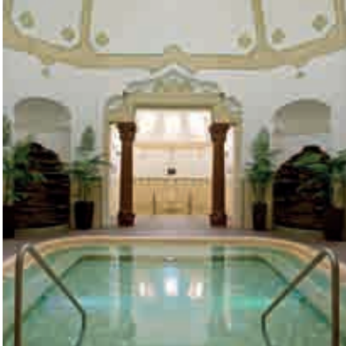
Arpad Bad ▲