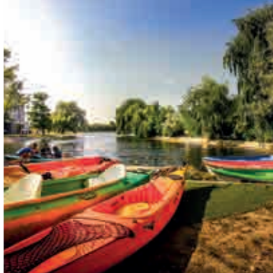
See zum Bootfahren ▲